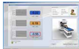
3. RayPilot® Mjukvara

RayPilot® är ett av två godkända system i världen för kontinuerlig positionsbestämning av en cancertumör i kroppen. En högre precision vid strålbehandling av cancer möjliggör: