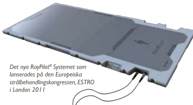
Det nya RayPilot® Systemet som lanserades på den Europeiska strålbehandlingskongressen, ESTRO i London 2011

Idag finns flertalet diskussioner igång med sjukhus som är intresserade av RayPilot® med flera offertförfrågningar.