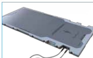
1. RayPilot® Mottagarsystem