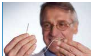
2. RayPilot® Sändare