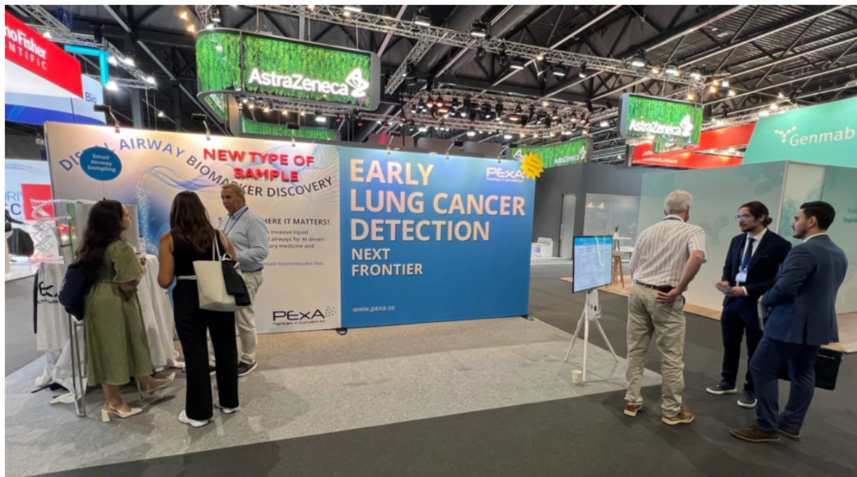
Besökare i PEXAs monter på World Conference on Lung Cancer (WCLC) i Barcelona i september 2025. Kongressen är världens största inom området och deltagandet markerar ett strategiskt steg i bolagets inriktning mot framtida lungcancerdiagnostik.

PEXA har inte några dotterbolag och ingår inte i någon koncern. Bolaget har inget innehav av egna aktier.