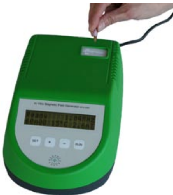
På bilden syns EURIS nya produkt In Vitro Magnetic Field Generator MFG-1000 (magnetfältsgenerator för medicinsk forskning).

Inom delar av medicinsk forskning såsom t ex vid behandling av sjukdomar med magnetiska nanopartiklar utnyttjas instrument som kan generera starka alternerande magnetfält. EURIS har sedan början av 1990-talet varit verksamt inom dessa forskningsområden. Bolaget har utvecklat ett nytt instrument (In Vitro Magnetic Field Generator MFG-1000) som är lämpat för kontrollerad magnetfältsexponering av provbehållare innehållande vävnader, celler eller biologiska vätskor. Totalt har ett lager av tio instrument producerats varav två har hittills blivit sålda. I mars månad 2009 upprättade bolaget ett icke-exklusivt distributionsavtal för den amerikanska marknaden med Ocean Nano Tech (USA) vilket dock ännu inte har resulterat i någon försäljning. EURIS kommer under perioden 25-29 maj 2010 att visa upp produkten på internationell konferens (The 8th International Conference on the Scientific and Clinical Applications of Magnetic Carriers) som hålls i Tyskland. Med vårt deltagande hoppas vi kunna etablera nya samarbetsprojekt samt genomföra konkreta affärer. Varje sålt instrument förväntas generera återkommande försäljning av magnetiska nanopartiklar som kommer att produceras av EURIS.