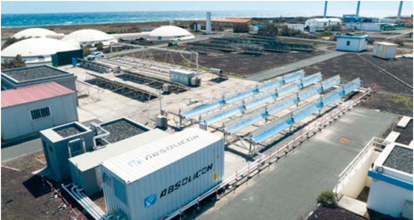
Installation hos forskningslaboratoriet ITC på Gran Canaria.