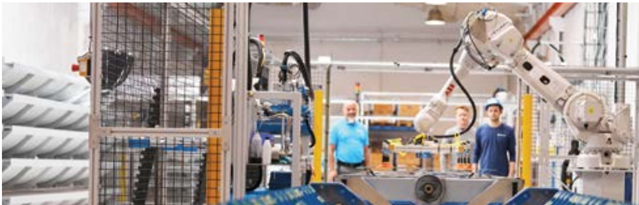
Absolicon robotiserade produktionslina är en "minifabrik" som massproducerar solfångare.